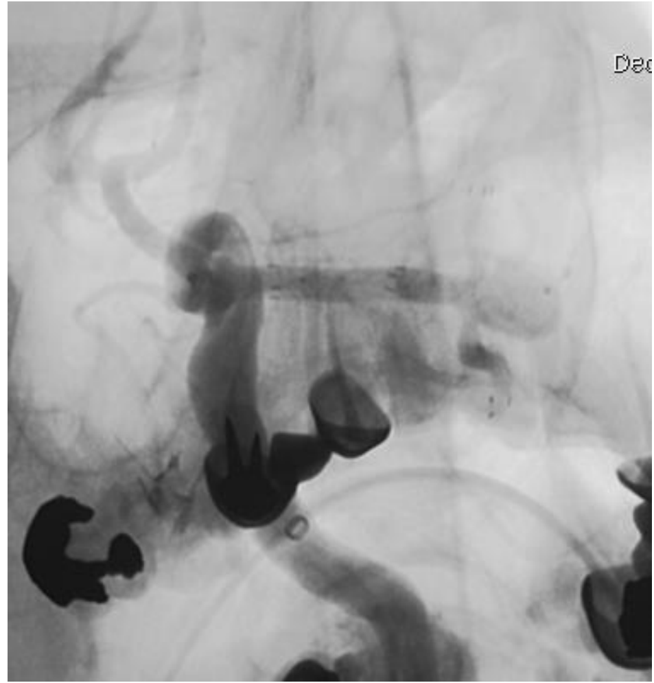
Fig.1 : Arteriografía que muestra el aneurisma de ACM izquierda de cuello ancho con origen de ambas ramas en la base del cuello