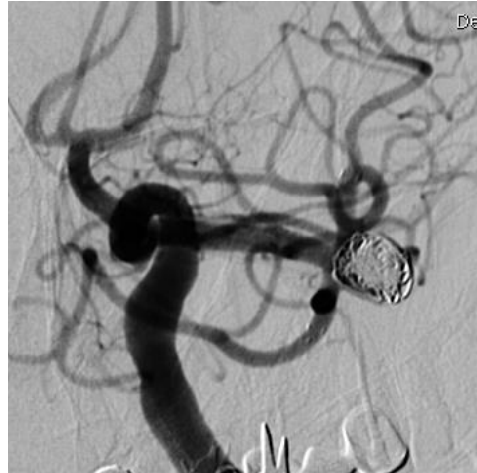
Fig.3 : Arteriografía sin (izquierda) y con substracción digital (derecha) que muestran la oclusión completa del aneurisma tras embolización endosacular con coils Target y preservación de ambas ramas de ACM gracias a la implantación de los stents "en Y".